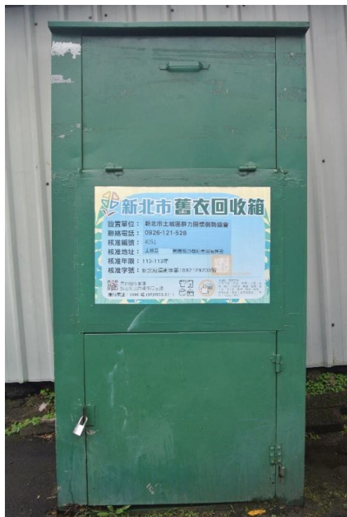
圖 2 合法舊衣回收箱