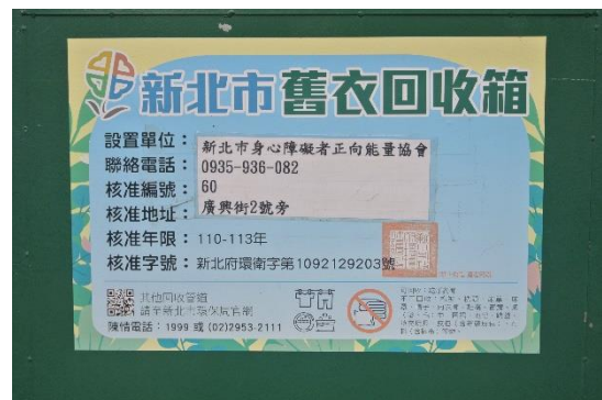
圖 3 環保單位核准標示